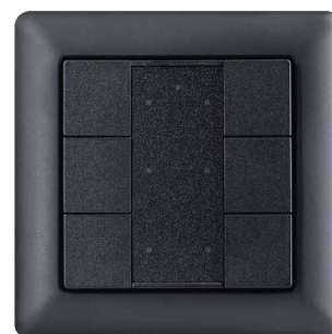
blanc: 146WD2 | noir: 146BD2