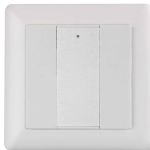
blanc: 142WD2 | noir: 142BD2