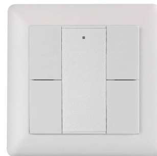
blanc: 144WD2 | noir: 144BD2